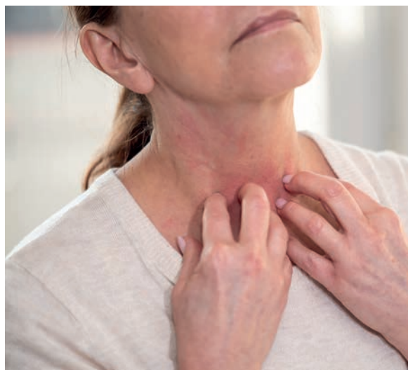
Oparzenia słoneczne, świerzbiczka, udar słoneczny, ale też trądzik, opryszczka, zmęczenie - to najczęstsze niepożądane skutki przebywania na słońcu.

trądzik punktowy z małym białym pryszczem na środku.